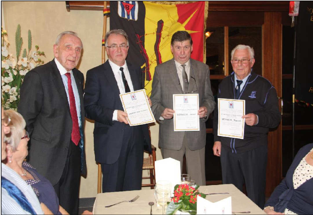
Uitreiking van de eretekens van erkentelijkheid