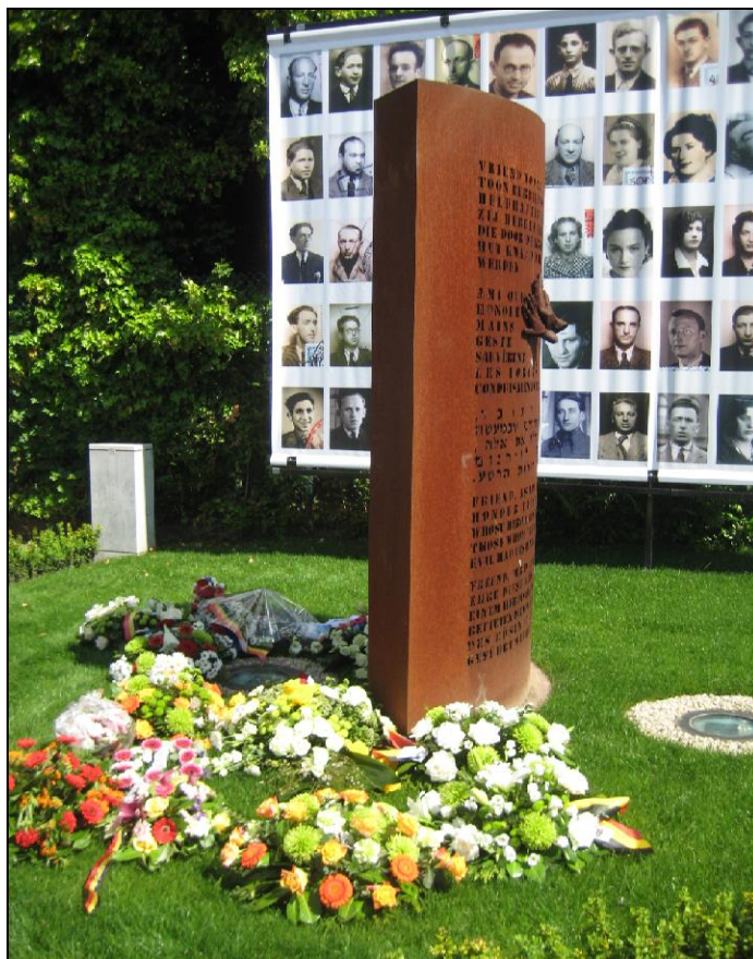
Na de bloemenhulde aan het monument

De plechtigheid werd afgesloten met het vaderlands volkslied waarna een copieuze broodjesmaaltijd werd aangeboden door de gemeente Boortmeerbeek in zaal Movri.