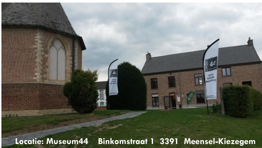
Locatie: Museum44 Binkomstraat 1 3391 Meensel-Kiezezem