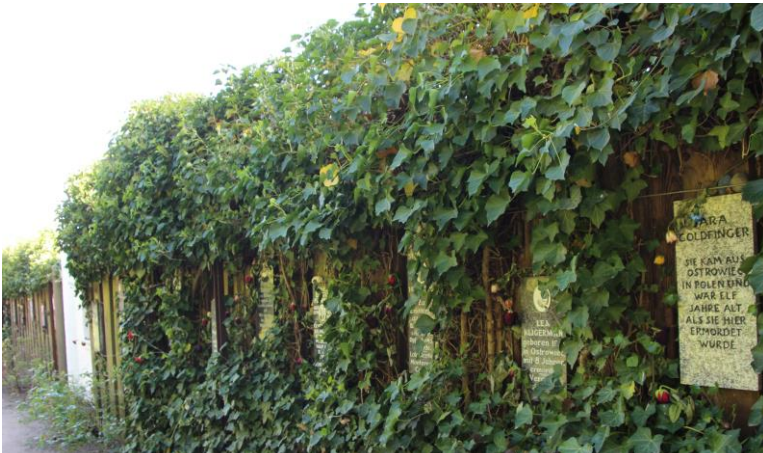
Gedenksteden voor de kinderen in de Rozentuin

De plaats van de misdaad is nu een monument. Ook zijn er gedenksteden voor de slachtoffertjes en een statig beeld voor de gesneuvelde Sovjets in de Rozentuin , waar we ook vertoefden, nadat we het studiecentrum, de moordkelders het donkere schilderwerk in de traphal hadden verkend. Naar Bergedorf dan waar we in het H4-Hotel naar rust snakten en ons al voorbereidden op de eigen Meensel- Kiezegem -Neuengammedag.