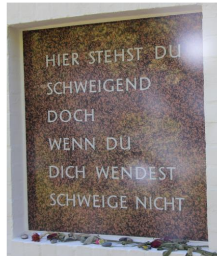
Dit opschrift spreekt voor zich . . .