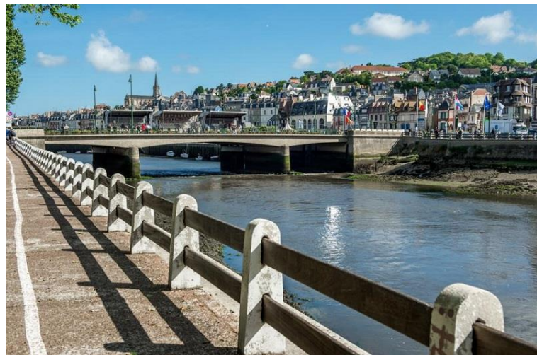
Deauville-Trouville Pont des Belges