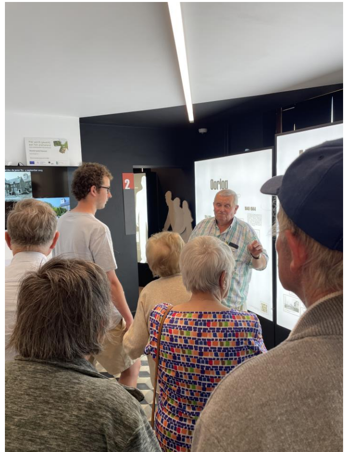
Het museum44 werd op moederdag druk bezocht.