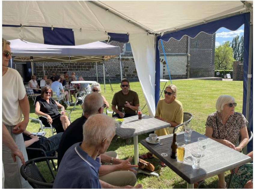
11 mei: Het werd een sfeervol samenzijn in het eerste museumcafé