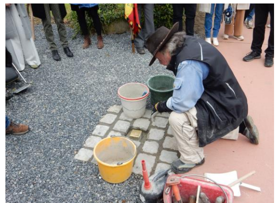
Gunter Demnig plaatste de eerste stolperstein voor Remigius Morren op 27 april 2024

Alle Stolpersteine die in Meensel-Kiezegem zullen geplaatst worden