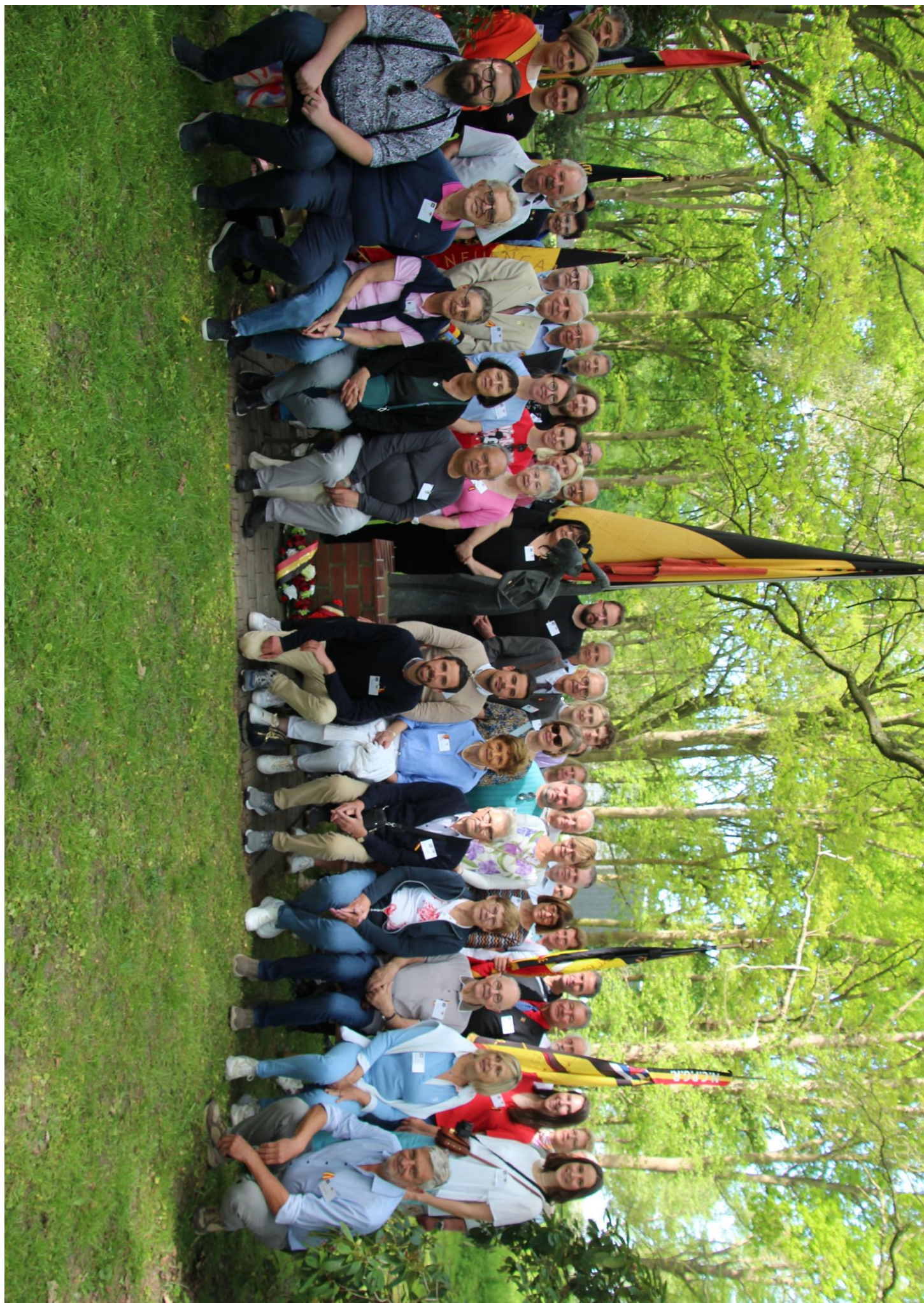
Het voltallige reisgezelschap verzameld aan het beeld “De wanhoop van Meensel-Kiezegem” in KZ Gedenkstätte Neuengamme op 2 mei 2025