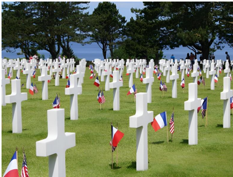
Omaha Beach -Colleville sur mer: Amerikaans kerkhof

Klokvast reizen is in dit opzicht een "Conditio sine qua non".