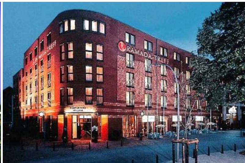
Link: verblijfplaats in Bremen, Golden Tulip Hotel Rechts: verblijfplaats in Bergedorf (Hamburg), Ramada Treff Hotel