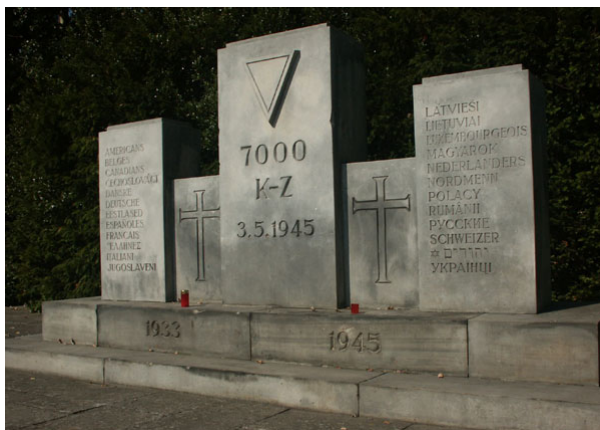
Herdenkingsmonument in Neustadt voor de slachtoffers van de gezonken schepen

WE ZULLEN OOK TRACHTEN IN HET VERBODEN KAMP VAN SANDBOSTEL BINNEN TE GERAKEN. IN BREMEN HEBBEN WE DAN, VERSPREID OVER DE TWEE DAGEN: BLUMENTHAL, SCHÜTZENHOF, OSTERHOLZERFRIEDHOF, FARGE.