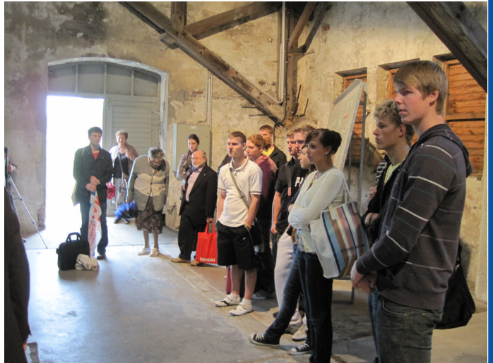
Duitse jongeren nemen deel aan de gidsing in de gebouwen van de "Klinkerwerke" in KZ Gedenkstätte Neuengamme