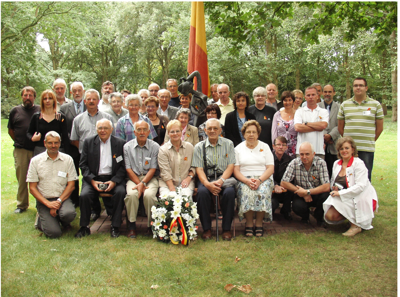
De deelnemers van de twaalfde herdenkingsreis

Tickets: 016 60 83 57 - "Höss" is niet geschikt voor kinderen.