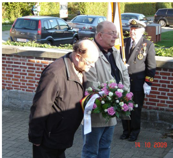
De Nelson Sweepers leggen bloemen neer aan het herdenkingsmonument te Kiezegem.