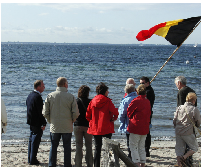
Sferbeeld in de Lübecker Bucht aan de Oostzee