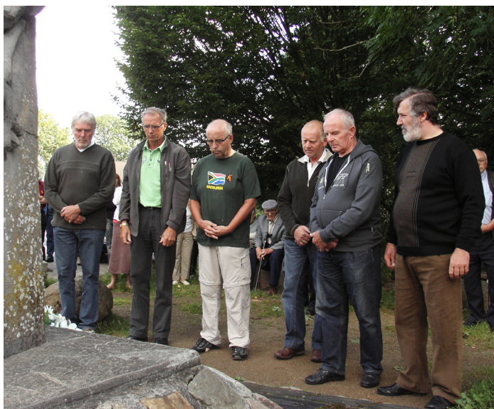
De Eikels (wielrenners) leggen bloemen neer samen met enkele nieuwelingen in Farge.