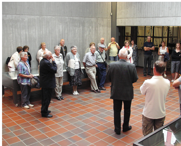
In de herdenkingshalle van KZ Gedenkstätte Neuengamme tijdens de twaalfde reis.

18u30 - Muzikaal Slot: Coincidence & Microphone Mafia