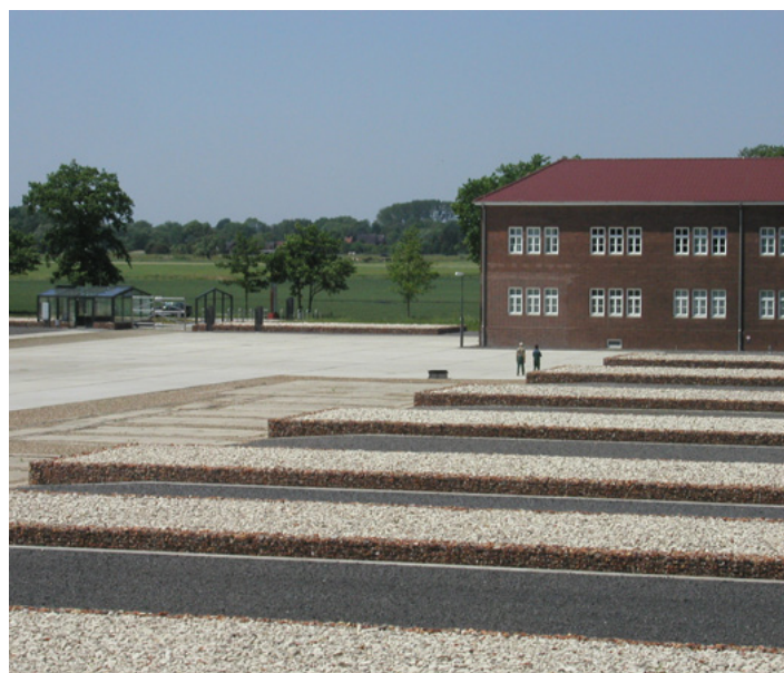
Overzicht op de ingang, het studiecentrum en de appelplaats met de keien die de fundamente van de voormalige barakken tonen.