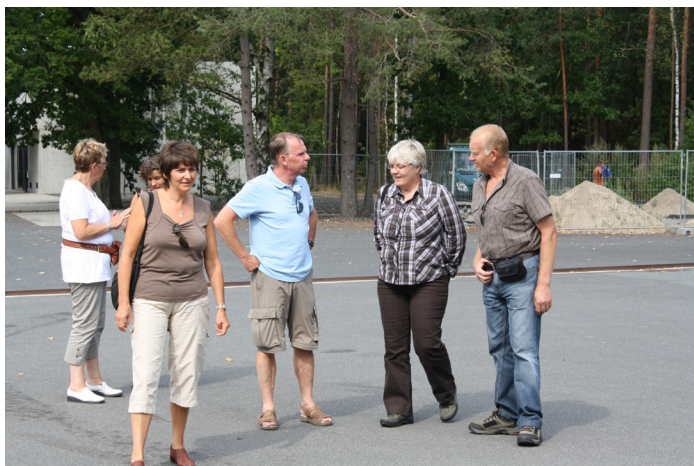
Enkele medereizigers in zware discussie...

In een kortere versie "à l'improviste" was dit onderstaande mijn antwoord en laat ik U hiermee genieten van mijn visie dewelke deugddoende onthaald werd. De plechtige ondertekening en de aanvaarding van de Universele Verklaring van de Rechten van de Mens was op 10 december 2008 Zestig jaar oud. De fundamentele Rechten van elke Mens ter bescherming van het individu gaan over recht van leven, recht van vrijheid, en recht van veiligheid. Men kan de wereld best beschermen tegen oorlog door continu een wereld van vrede en verdraagzaamheid te scheppen waardoor iedereen met respect en vertrouwen met mekaar kan omgaan. Wanneer dat niet gebeurt leven we op voet van oorlog. Nog maar enkele weken zijn bij ons de hoogstaande herdenkingen van elfnovember aanstaande. Dit naar aanleiding van de negentigste verjaring. Wereldoorlog I eindigde op 11 november 1918 met als nasleep de leuze NOOIT MEER OORLOG. Dat hoorden we meermaals. Zelfs na elk gewapend conflict. Ook toen. Alleen voor het gecapituleerde Duitsland zouden daar andere gedachten uit groeien. Inderdaad, de tijd van het interbellum tussen