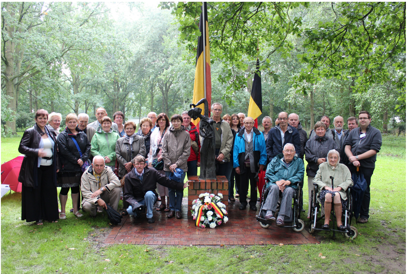
De medereizigers van de 14e Herdenkingsreis naar Noord-Duitsland bij het beeld "De Wanhoop van Meensel-Kiezegem" in de voormalige tuinen van de SS in KZ Gedenkstätte Neuengamme