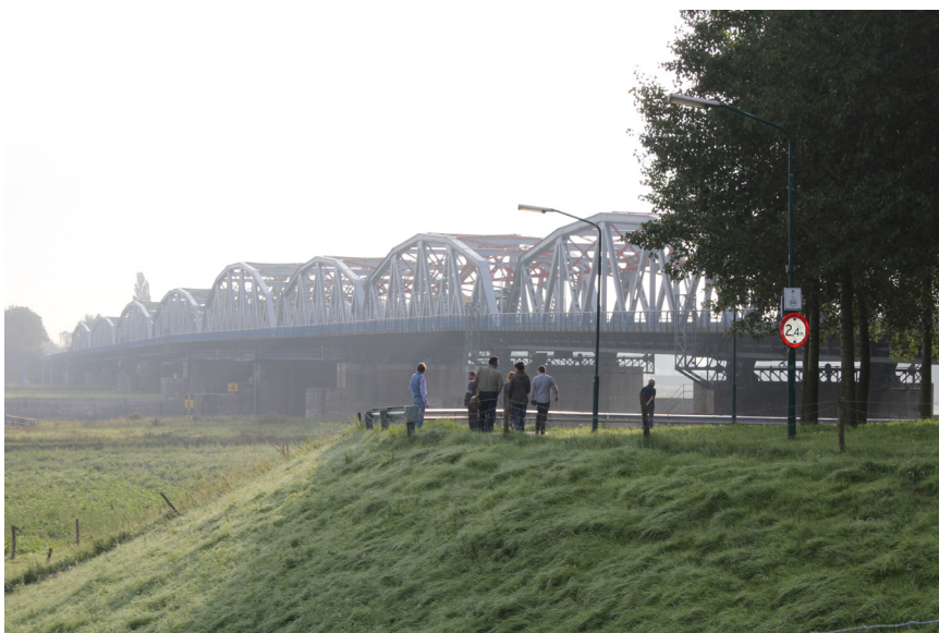
De medereizigers van de 14e herdenkingsreis bij de brug van Grave, op weg naar Arnhem