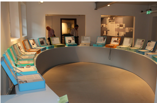
De volledig vernieuwde site van Bullenhusser Damm.

Deze avond volgde onze "culturele" Hamburgtrip. Bij deze wandeling werd toch de knop noodzakelijkerwijs even omgedraaid. Het werd een evenement dat op een bruisende manier voor ontspanning zorgde in de "Veermaster". Ook in de autocar naar het hotel bleef de stemming er inzitten. Streng, maar rechtvaardig, zorgde de reisgids ervoor dat iedereen bijtijds in bed lag om 's anderendaags fit aan de terugreis te beginnen.