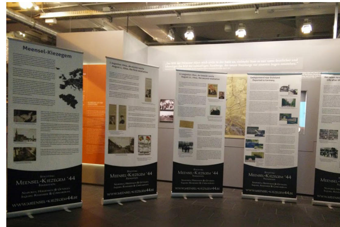
Boven: Onze allernieuwste 'popup' tentoonstelling werd voorgesteld op 30 januari in de Sint-Nikolaikerk in Hamburg