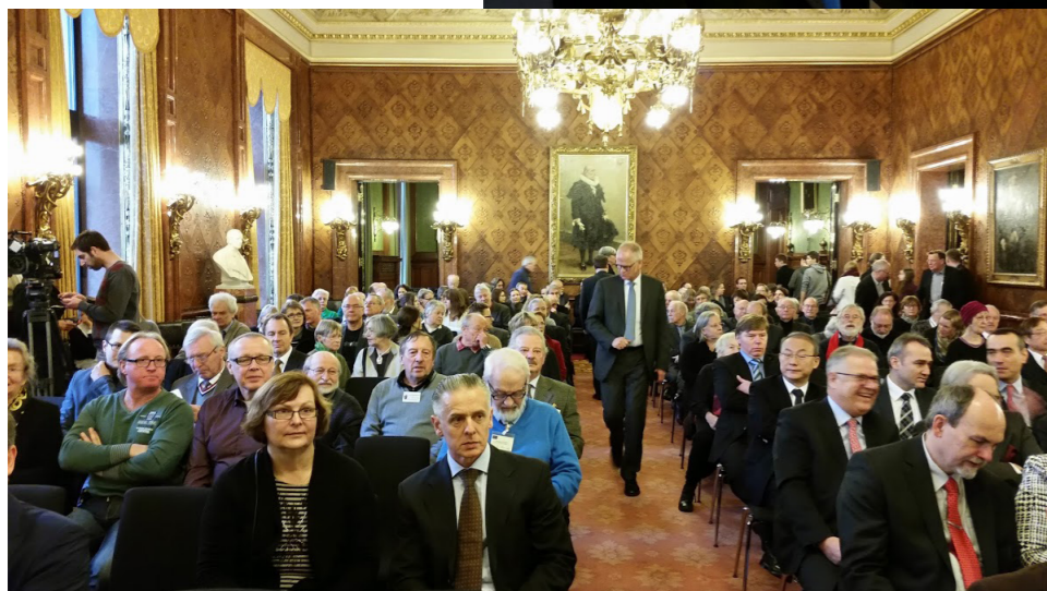
De vele notabelen tijdens de openingsceremonie in het Hamburgse Rathaus.