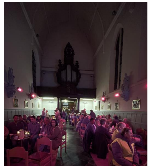
Kerstseer in de kerk van Meensel