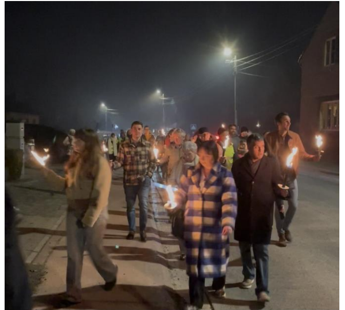
De vele wandelaars komen met het vredeslicht toe in Meensel