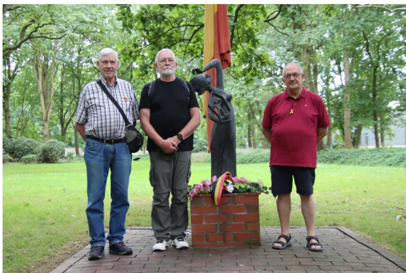
Aan het beeld "De Wanhoop" in Neuengamme tijdens de herdenkingsreis van 2024.