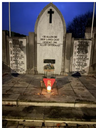
Het vredeslicht werd geplaatst in de kapel aan het erekerkhof (L) en aan het monument in Kiezegem (R)